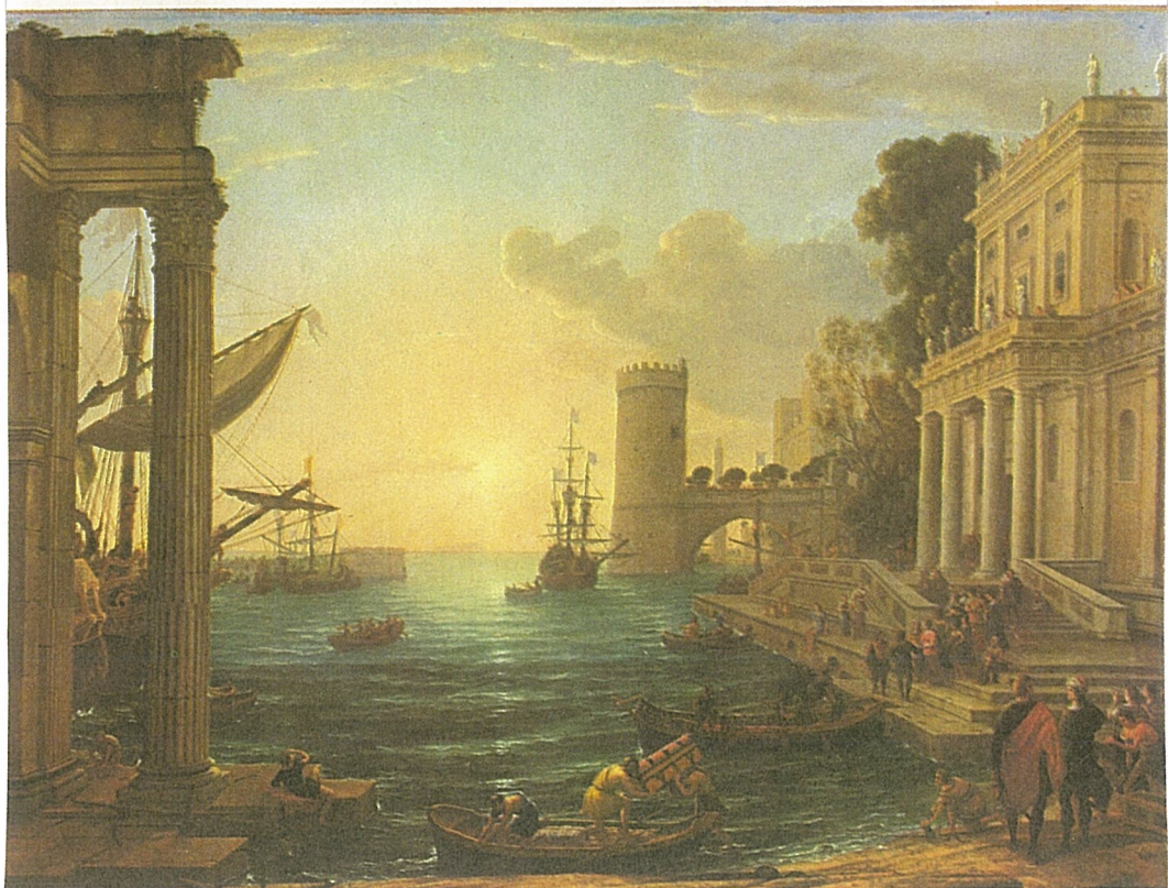
5 Claude Lorrain: The Embarkation of the Queen of Sheba , 1648.